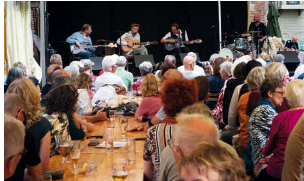
De Gentse- en Patersholfeesten trokken duizenden feestvierders & muzikliefhebbers.