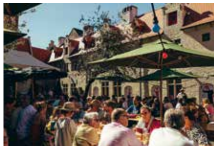
Zo 11.08 Rommelmarkt in het Patershol, heerlijk terras in de binnentuin.