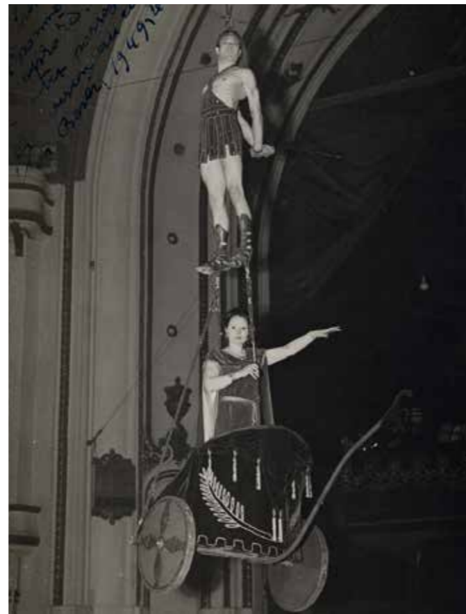
Spectaculaire act van Les Treblas, 1949.

Na een zware brand was de schade enorm. De heropbouw, onder leiding van architect Ledoux, startte drie jaar later. Het nieuwe gebouw was nog imposanter met allerlei technologische innovaties en een capaciteit van 3.400 personen. "Het mooiste circus van Europa" volgens de pers. Er trokken heel wat grote internationale circussen en wereldberoemde artiesten naar Gent.