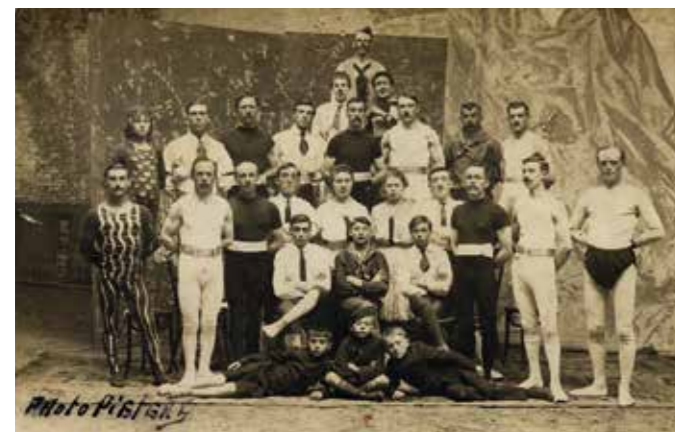
Barnum in Gent, Nieuw Circus, 1917.

Tijdens de Eerste Wereldoorlog waren er zo goed als geen voorstellingen in het Wintercircus. Veel artiesten verbleven wel in Gent. Samen creëerden ze de revue 'Barnum in Gent', een verwijzing naar Barnum & Bailey, het grootste circus ter wereld.