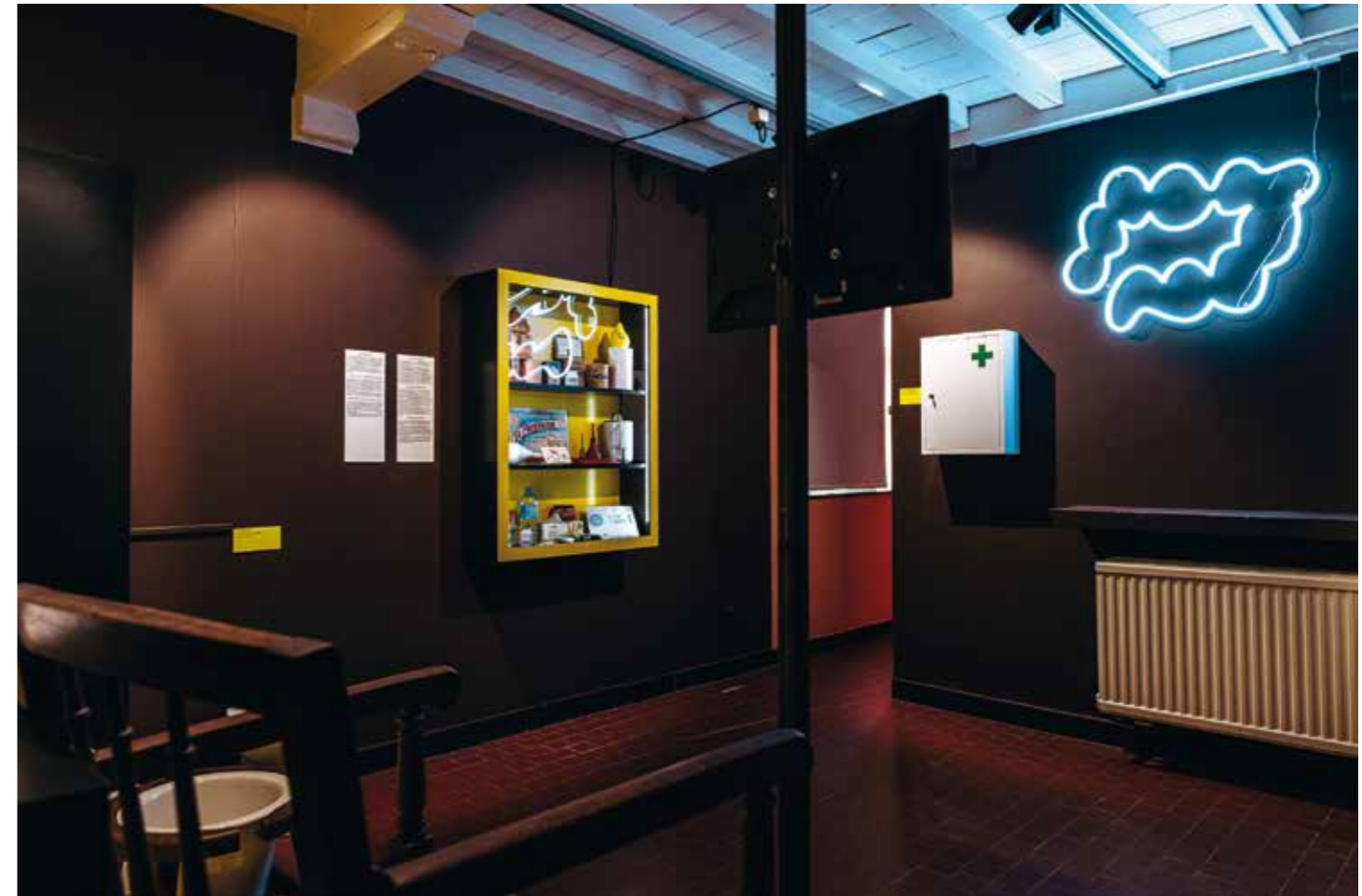
Beelden expo Ja santé!