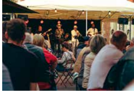
Vr 09.08 Le Global