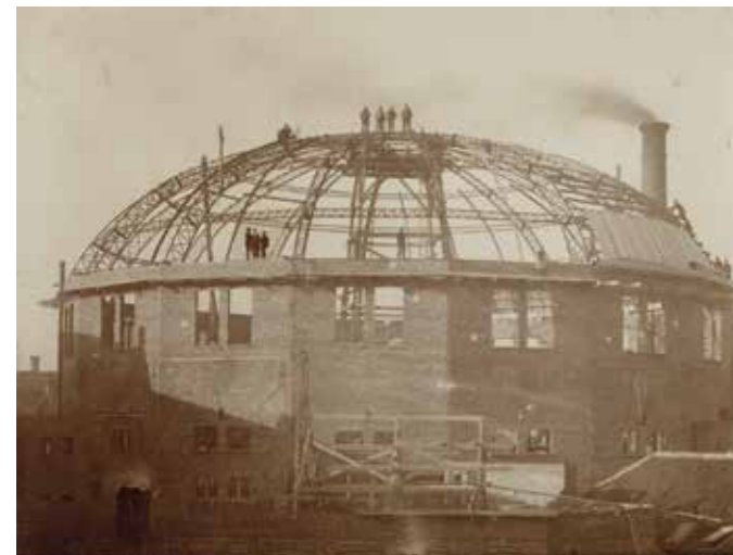
Bouw van het Nieuw Circus, 1894, Gent. Collectie Guy Puttevils

Het Nieuw Circus werd gebouwd op het terrein van de voormalige katoenfabriek Vandekerkhove, de locatie van het huidige Wintercircus aan de kruising van de Sint-Pietersnieuwstraat, de Lammerstraat en de Kleine Huidevettershoek. De plannen werden ontworpen door architect Emile De Weerd.