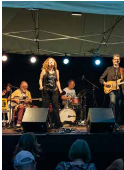
Za 10.08 I H8 Camera