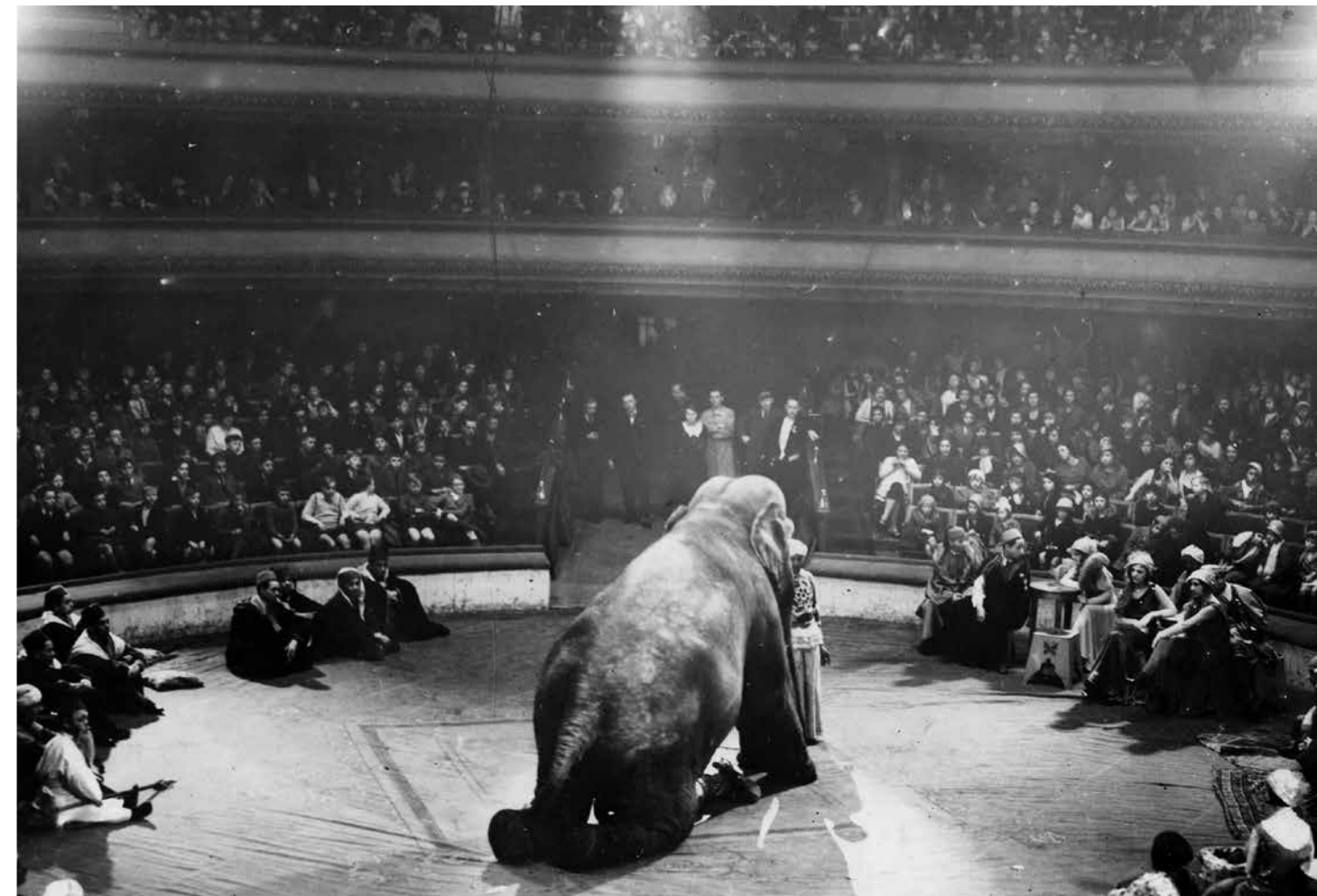
Optreden met olifant in het Nieuw Circus, Gent.

Na een lange renovatie opent het Wintercircus terug zijn deuren.