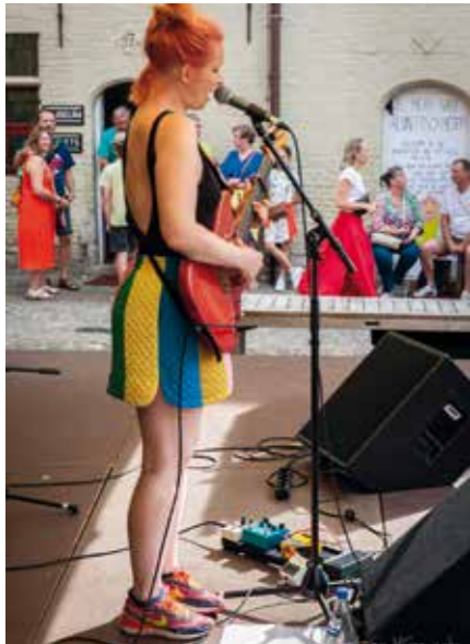
Veel gezelligheid en feestvreugde in de binnentuin deze zomer.