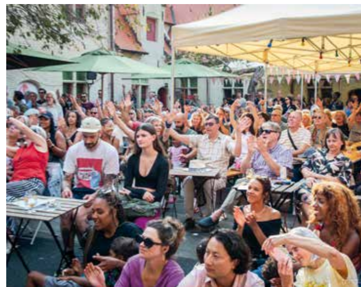
Ook de jonge (en niet meer zo jonge) kinderen konden lachen, gieren en brullen met de avonturen van Pierke van Alijn.