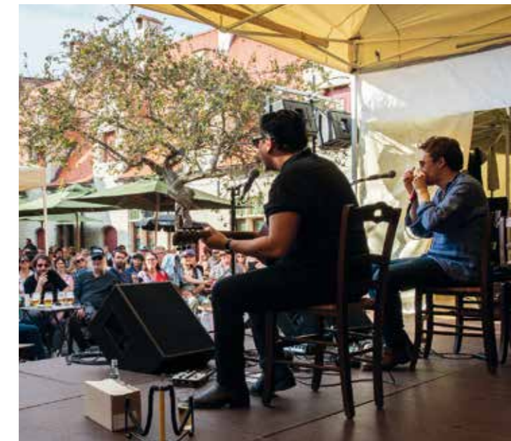
Dikke merci aan de Vrienden van Alijn voor de organisatie.