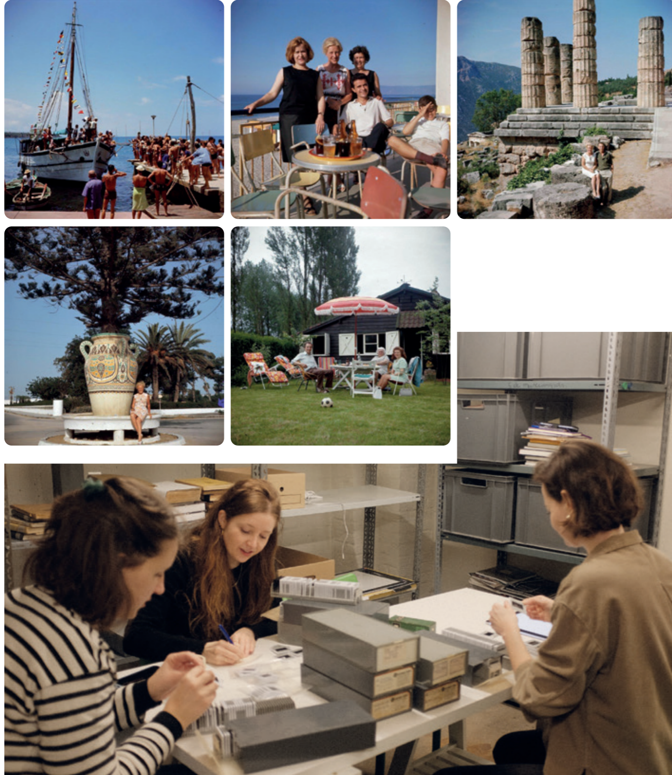
Hoe ziet een DIA-donderdag eruit? Odelinde: We bekijken de dia's en maken een selectie. Deze selectie zal gedigitaliseerd, genummerd en geregistreerd worden als collectie. Ze worden verpakt en later ook digitaal ontsloten, onder andere op de website.

Tijdens de DIA-donderdagdagen kwamen de collega's van team collectie en onderzoek en team data- en informatiestrategie bijeen om een reeks van maar liefst 50.000 dia's te bekijken en te selecteren. De dia's zijn in het verleden aangekocht door of geschonken aan het museum.