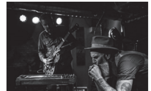
Kaai Man & De Oeverlozen