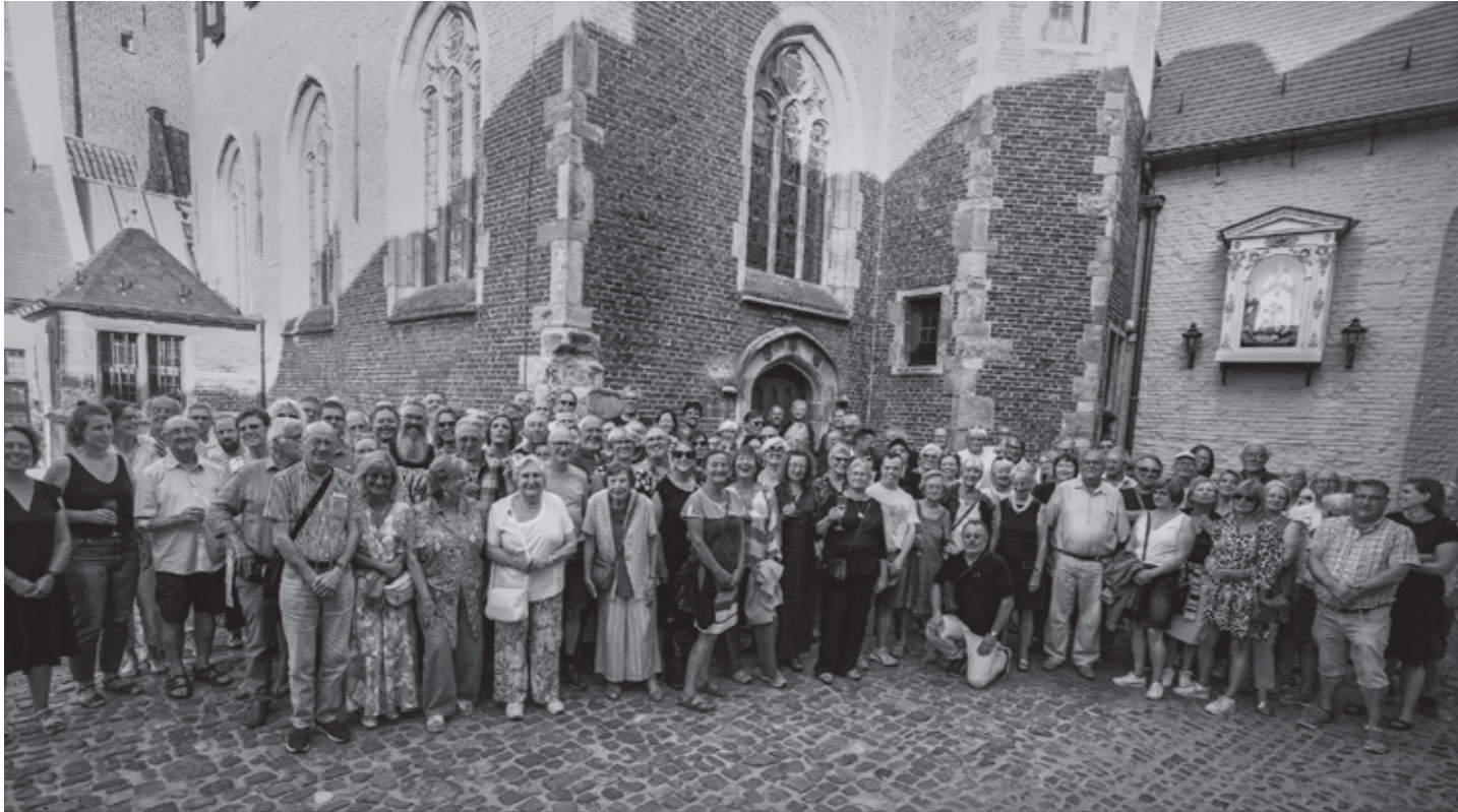
Vrijwilligersploeg 2023

Voor de 11e keer organiseren de Vrienden van Alijn de Gentse Feesten: het hoogtepunt van het jaar! Concerten in de binnentuin, aperitieven met de harmonies en plezier met Pierke van Alijn: het belooft weer een fijne zomer te worden.