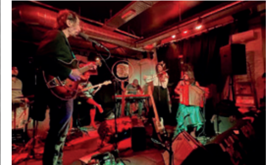
There will be birds