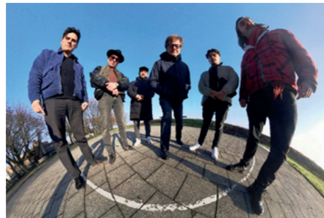
do 20.7 Antwerp GipsySka Orchestra