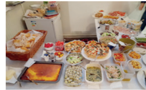
Collega Ellen maakte courgette-oreganopannenkoekjes. Zelf thuis proberen?