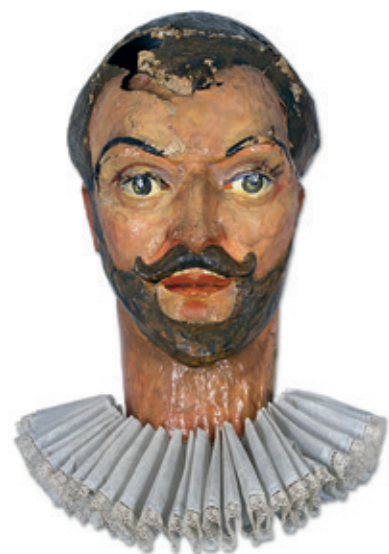
Het hoofd van Albrecht – voor de restauratie – met de ingedeukte bovenkant goed zichtbaar.