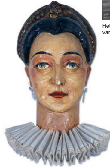
Het hoofd van Isabella – voor de restauratie.