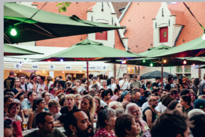
TERUGBLIK OP EEN ZALIGE ZOMER