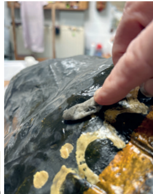
Oppervlaktereiniging van het hoofd van Isabella.