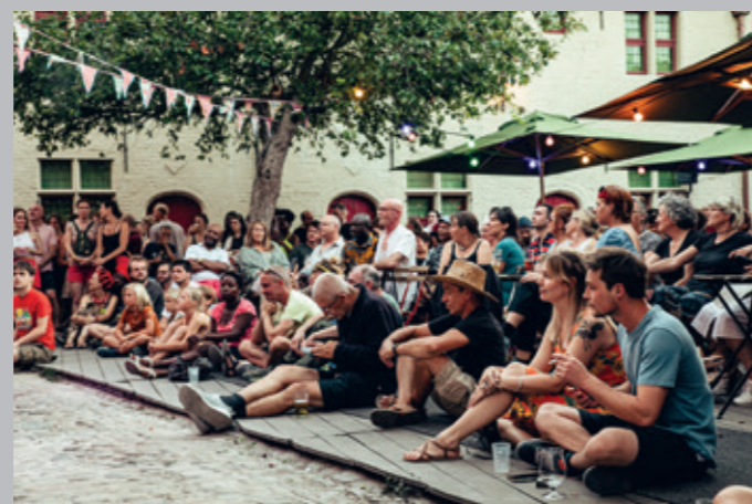
Gentse Feesten & Patersholfeesten* zonder coronamaatregelen.