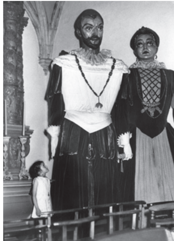
Het reuzenkoppel tentoongesteld in de voormalige kapel van het Museum voor Volkskunde, jaren 1970

We verwelkomen de hoofden binnen enkele weken terug, klaar om er verder zorg voor te dragen en ze met het publiek te delen.