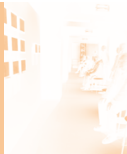
EXPO Het dagelijks leven in bewegend beeld

In het kader van deze expo nodigen we filmmakers uit om met het materiaal aan de slag te gaan. Twee films zijn reeds te zien in het museum: Schimmen uit de jaren '50 van Julien Vandevelde en Zoete Zeventig van Kadir Balci. Een derde film wordt momenteel gemaakt door filmregisseur Lieven Debrauwer. Deze film zal in première worden getoond op de 34ste editie van het Internationaal Filmfestival Gent. U leest er meer over in het volgende museumjournaal.