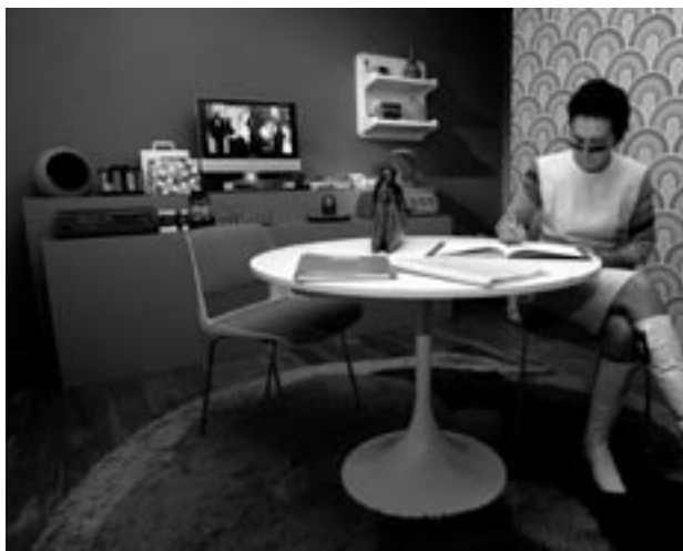
Het Huis van Alijn (2000 – ...)

De naamwijziging diende deze nieuwe positionering te onderstrepen. Het museum schrijft als museum van de dingen die (n)ooit voorbijgaan met volle overgave mee aan dit nieuwe erfgoedparadigma. Het Huis van Alijn wil een huis zijn met een open deur op de wereld. Een huis dat op een creatieve en kwaliteitsbehoudende manier met erfgoed omgaat waarbij de relatie met de bezoeker en de omgeving wordt vernieuwd en verstevigd. Naast de herwaardering en ontsluiting van de collectie verdient ook de maatschappelijke rol van het museum onze grootste zorg. Het publiek vond de weg terug naar het museum en niet langer alleen als bezoeker, maar ook als participant. De publieksbetrokkenheid zal in de komende jaren alleen maar groter en dichter worden. Daar geloven we in. Daar gaan we voor. Hier ligt de toekomst van het museum. Het is zijn bestaansrecht.