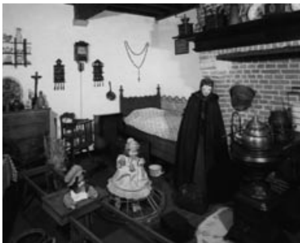
Museum voor Volkskunde (1962 – 1999)