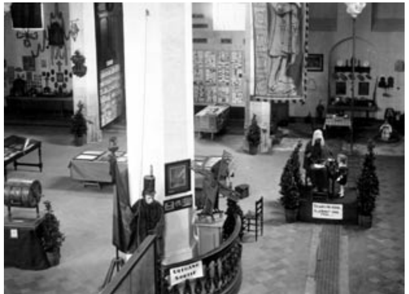
Folkloremuseum (1932 – 1962)