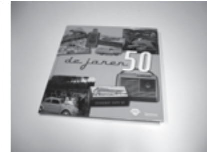
links boek: Randoald Sabbe boven boek: Studio Lannoo