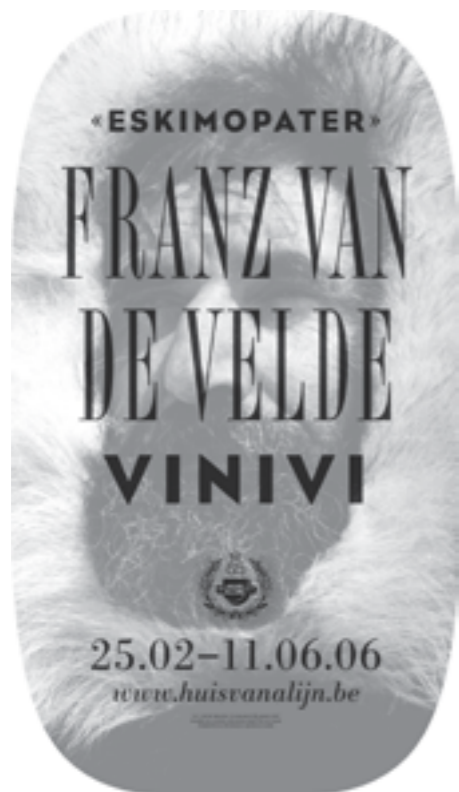
affiches: Randoald Sabbe