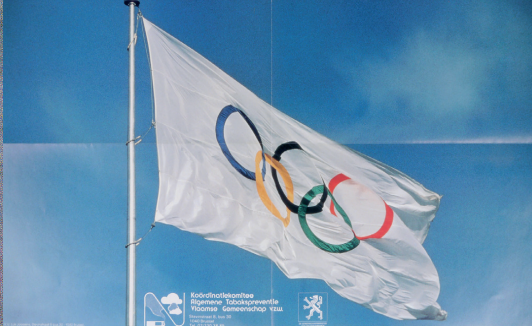
2. Ca. jaren 1990