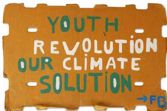
Pancarte klimaatmars 2018, collectie Huis van Alijn