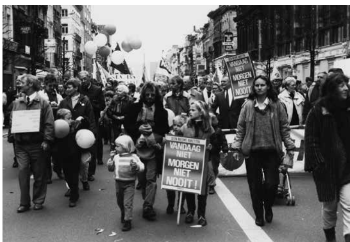
Gezinnen betogen tegen kernraketten 1983