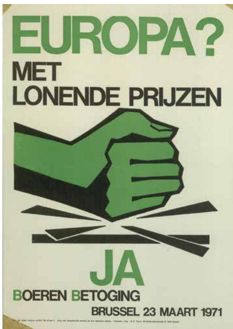
Affiche boerenbetoging 1971