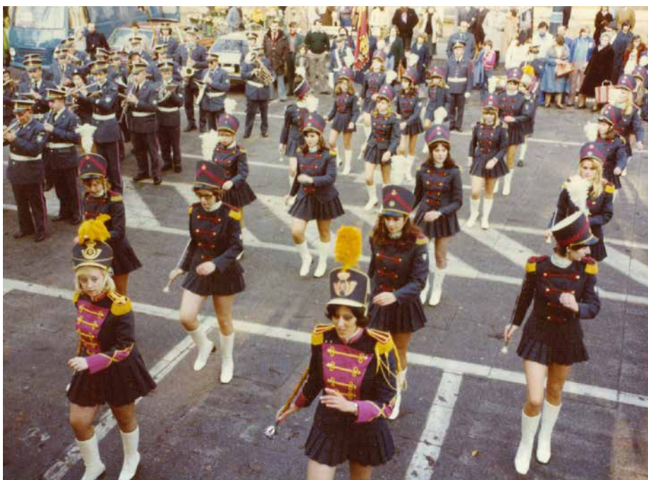
De Postharmonie Gent 1976, collectie Huis van Alijn