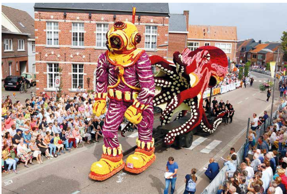
Bloemencorso Loenhout 2016