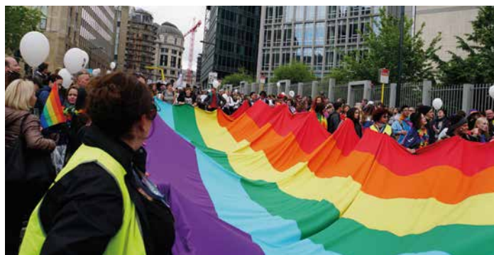
Belgian Pride Brussel 2016, ©Miguel Discart