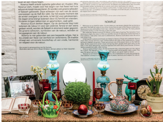
Nowruz in het Huis van Alijn.