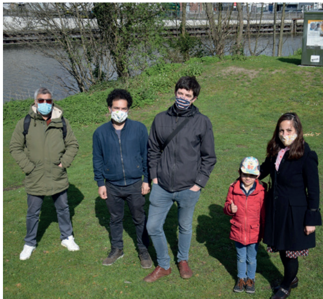
Vieren van Sizdeh Bedar (de dertiende dag van Nowruz) samen met de initiatiefnemers.

Naar aanleiding van een vraag vanuit de erfgoedgemeenschap, doorliepen we in 2021 een co-creatief traject rond Nowruz, het Perzische nieuwjaarsfeest. Dit project is een toonbeeld van hoe we in het Huis van Alijn ook in de toekomst willen werken met immaterieel erfgoed. Het project omvatte presentatie (een typische haft sin tafel in de hoofdtentoonstelling), publieksactiviteiten (verkoop van een Nowruz box om zelf thuis te koken in coronatijden), collectieverwerving en onderzoek (focusgroep met deelnemers uit de Afghaanse, Iraanse en Koerdische gemeenschappen). Dit project ontstond uit een initiatief vanuit de erfgoedgemeenschap zelf en elk aspect kwam co-creatief tot stand met enkele enthousiaste mensen uit de Afghaanse en Iraanse gemeenschappen. Door de coronamaatregelen bleef het aantal betrokkenen beperkt, maar dankzij creatieve ingrepen konden we toch een groot publiek bereiken. We werkten samen met De Centrale, waar online live concerten werden georganiseerd, en de Nowruz box (in partnerschap met Oxfam, De Krook, Orbit vzw, Belmundo, Urgent. fm, Dental Mission Afghanistan, Meli België) werd verkocht in het museum, De Centrale en de Oxfam Wereldwinkel in Gent. De inzichten uit dit project over de omgang met immaterieel erfgoed deelden we met de sector in binnen- en buitenland (ICOM CECA conferentie, lerend netwerk WIE, FARO ...).