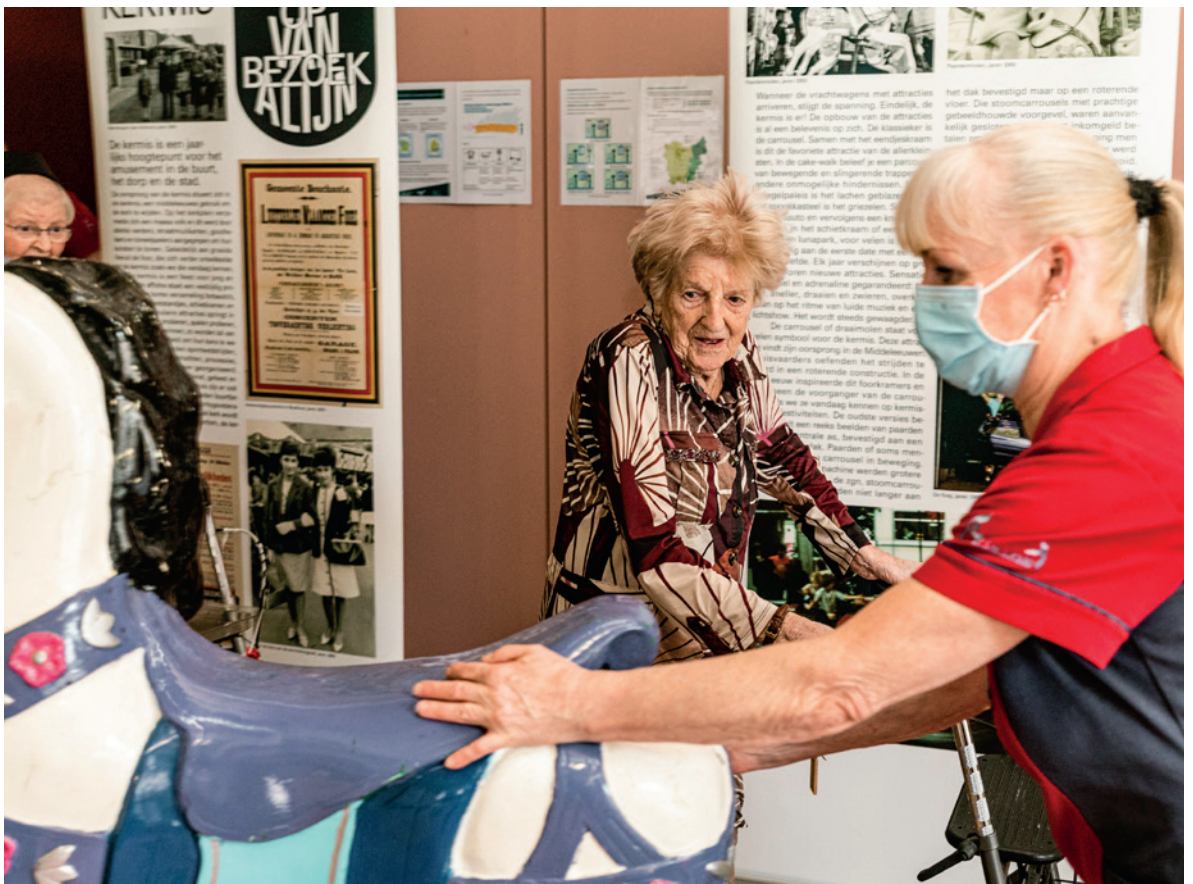
Huis van Alijn op bezoek, Kermis, WZC De Linde.