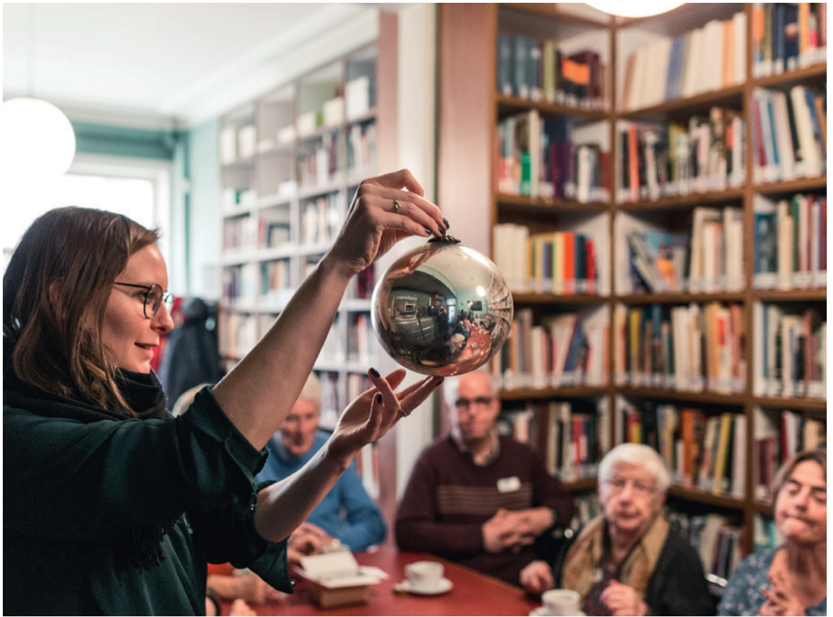
Sessie 'object handling' in het Huis van Alijn.